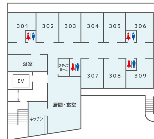
2F・3F グループホーム