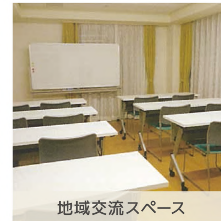
地域交流スペース