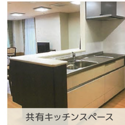
共有キッチンスペース